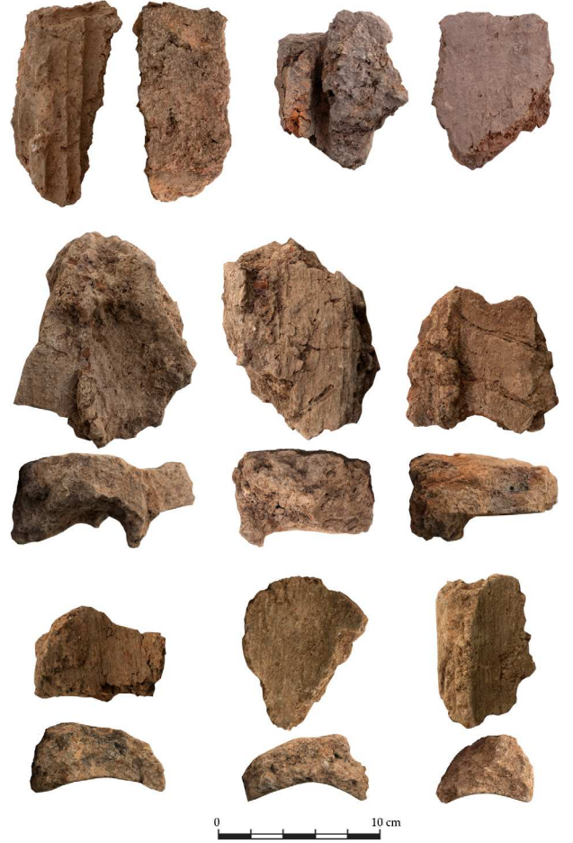
FIG. 2 Girmeler clay lumps. RES. 2 Girmeler kil topakları.

Excavations were carried out in the space measuring 17.5 x 19 m south of the parliament building complex on the eastern slope of Tlos’ acropolis. During the excavations, initiated at the level of the south door opening to the stadium diazoma, a square planned space adjacent to the city wall, built with rubble stones without any clamps, was unearthed. With the help of finds unearthed in this area, the arrangement of the space can be dated between the 10th-13th centuries AD. The first architectural finds belonging the original phase of the parliament building are the wall extending in an east-west direction and the niche arrangement on the west wall. The niches, of which only the upper part were excavated, extended in a southerly direction with an average distance of 1.55 m. Thus, the first finds on architectural planning, reached in the southern and northern spaces, were ornamented with niches (fig. 3). This similarity in planning is also observed in the construction technique, with the alternating use of bedrock and block masonry techniques in the southern space. The ceramics unearthed in the southern area are dated from the Classical period to the Ottoman period in accordance with the general fill context of the acropolis. The ceramic waste showing Late Classical and Hellenistic period features and found in the northwest corner of the south room is thought to belong to the rock-cut tombs at the upper level of the rock (fig. 4).