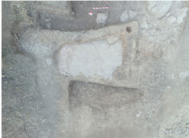
FIG. 1 Girmeler painted terrazzo floor.

The Girmeler settlement, located approximately 5 km northwest of Tlos, is known to have been used since prehistoric times. Unfortunately, the mound elevation in front of the cave was destroyed by construction equipment in 1985. Dated to the 9th millennium BC and with the scientific excavations initiated in 2010, the aceramic layer is the earliest settlement remains of the Lycian region. During the 2020 excavation season, the terrazzo