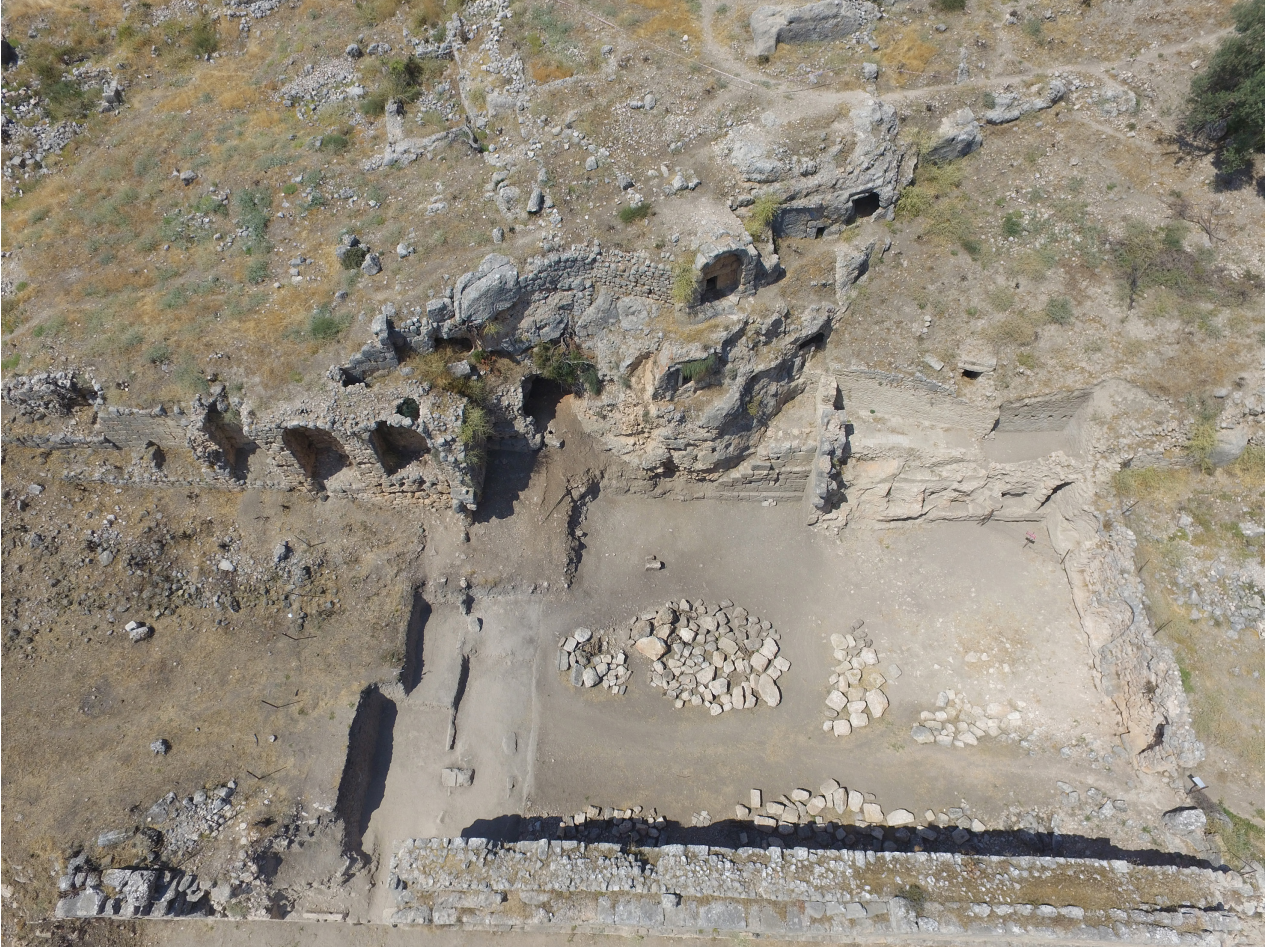
FIG. 3 Parliament Building complex. RES. 3 Meclis Binası yapı kompleksi.