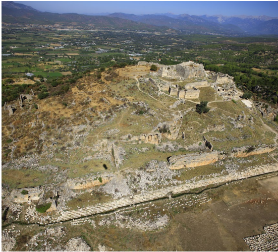
fig.2 Tlos Antik Kenti akropolü