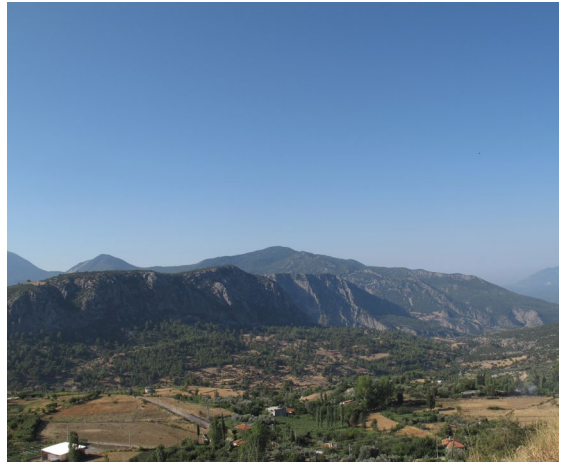
fig.7 Arsa Köyü yerleşimi