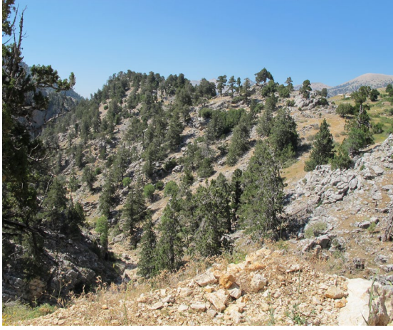
fig.4 Kastabara (Darıözü Yaylası) yerleşimi