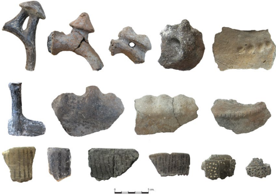
fig.12 Tavabaşı Mağaraları Orta Kalkolitik Çağ seramik buluntuları