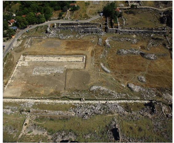
fig.13 Tlos Antik Kenti stadyum alanı