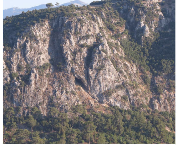
fig.11 Tavabaşı Mağaraları