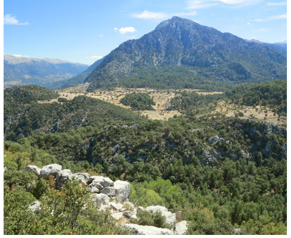
fig.5 Platane (Köristan Yaylası) yerleşimi