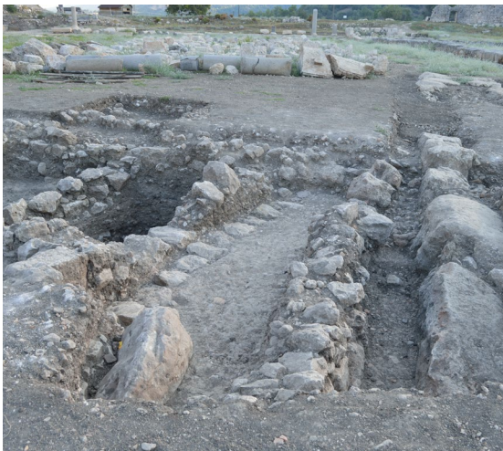
fig.14 Stadyum alanı Prehistorik Çağ yapı kalıntıları