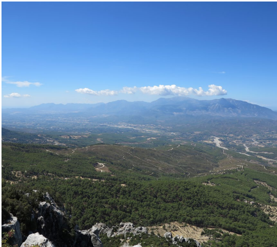
fig.8 Akdağlardan Xanthos Vadisi