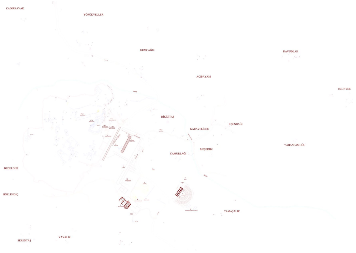
fig.16 Tlos Antik Kenti Hellenistik Dönem ve sonrası yerleşim planı