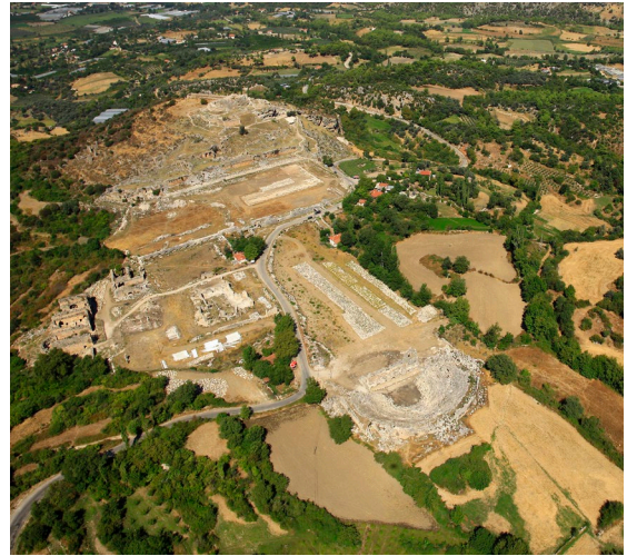
fig.3 Tlos Antik Kenti Klasik Dönem yerleşim alanları