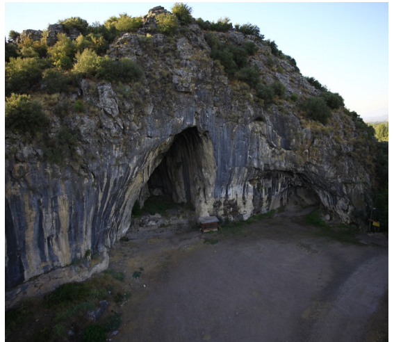
fig.9 Girmeler Mağarası/ Höyüğü