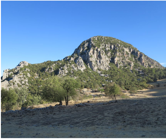
fig.6 Dikmen Tepe askeri yerleşim alanı