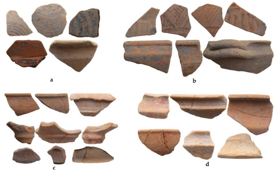
fig.15 Stadyum alanı Tunç Çağı ve Erken Demirçağ seramik buluntuları