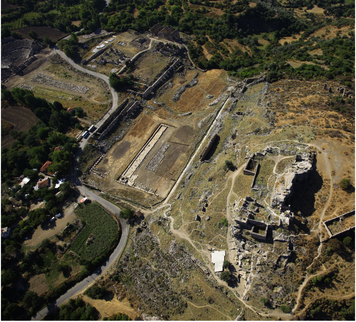
fig.1 Tlos Antik Kenti havadan görünüm