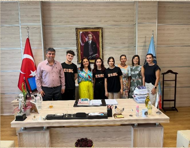
Antalya Erünak Sosyal Bilimler Lisesi Müdürü ve öğretmenleri 30 Eylül 2023 tarihinde Fakültemizi ziyaret etmiştir.