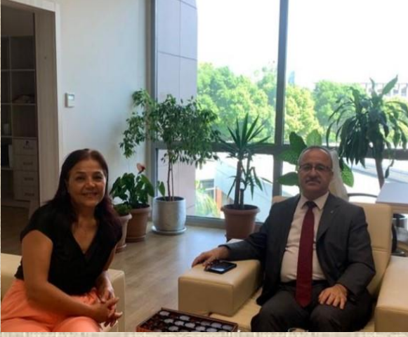
Antalya Bölge Adliye Mahkemesi (BAM) Başkanı Orhan ÖZDEMİR 19 Eylül 2023 tarihinde Fakültemizi ziyaret etmiştir.