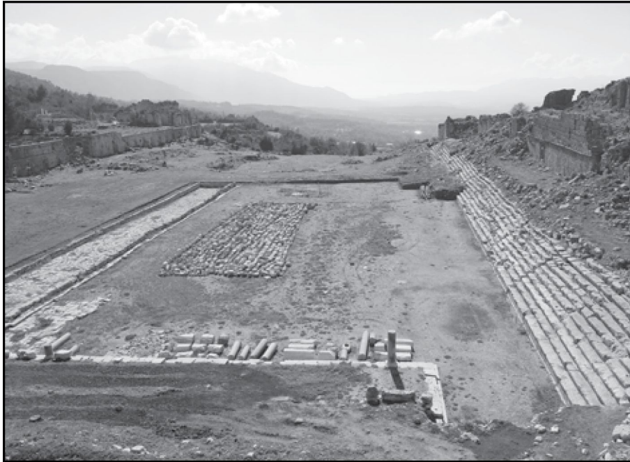
Resim 6: Stadyum alanı