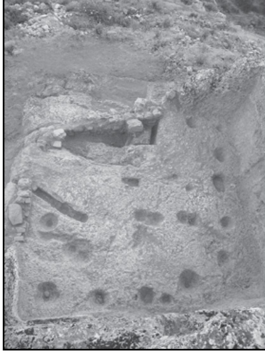
Resim 3: Akropol Kutsal Alanı