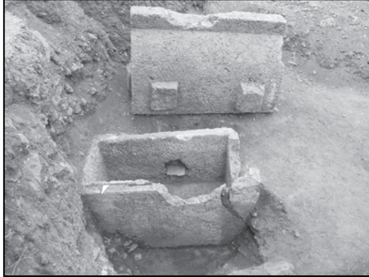
Resim 1: Aleksandros Lâhdi