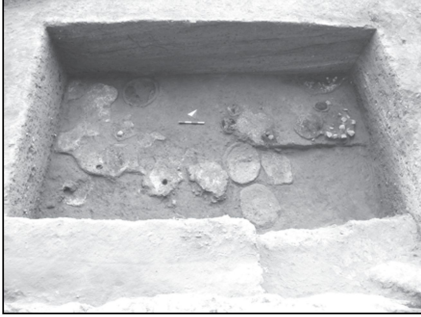
Resim 13: Girmeler Mağarası A Sondajı