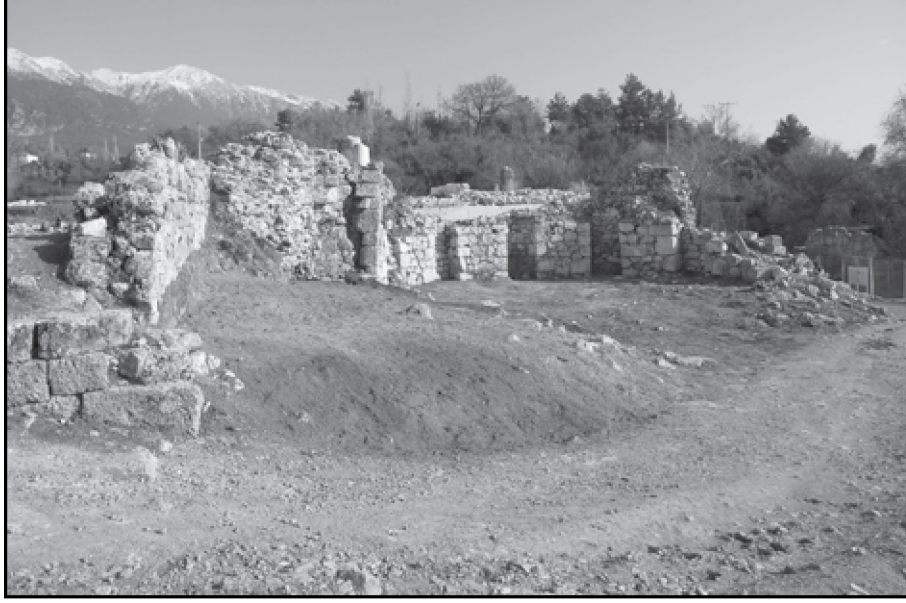
Resim 9: Eksedral yapı