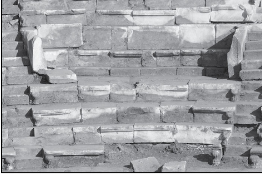
Resim 5: Tiyatro Logeion bölümü