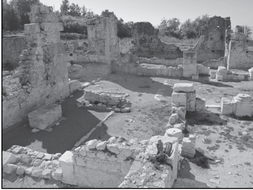
Resim 11: Kent Bazilikası