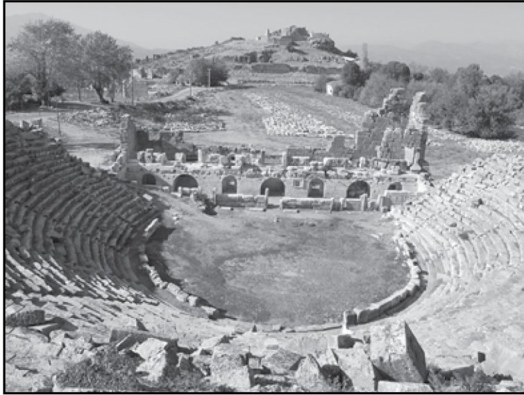
Resim 4: Tiyatro, orkestra