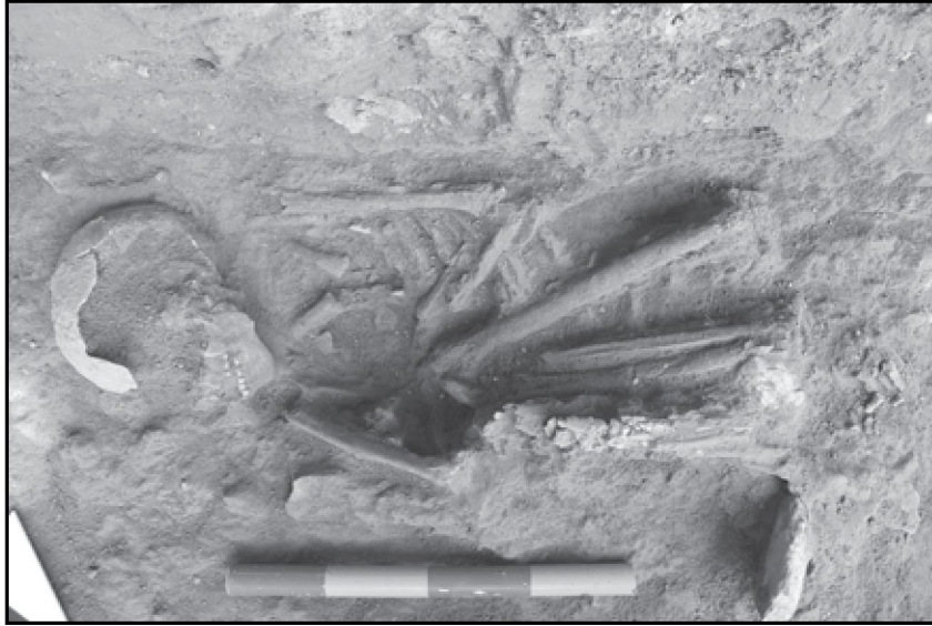
Resim 14: Girmeler Mağarası C Sondajı