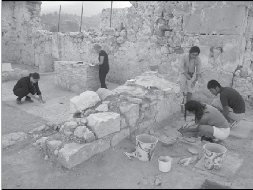
Resim 12: Kent Bazilikası mozaik döşeme konservasyonu