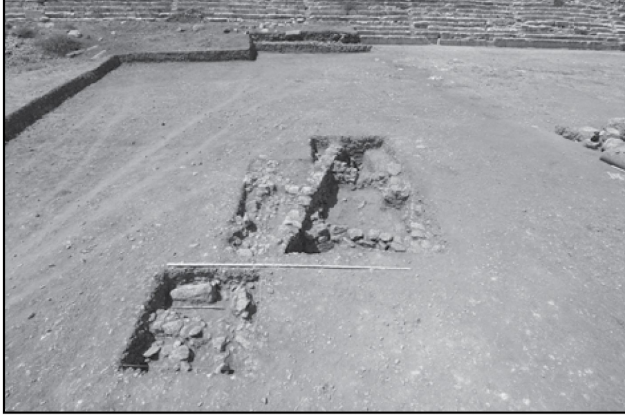
Resim 7: Stadyum alanı Geometrik Dönem yerleşimi