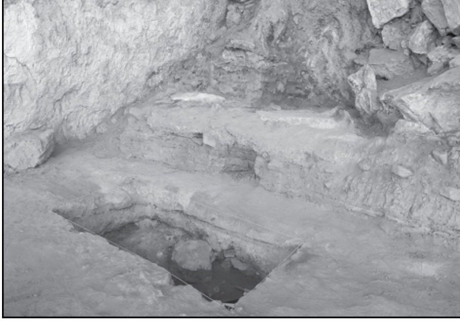
Resim 15: Girmeler Mağarası D Sondajı