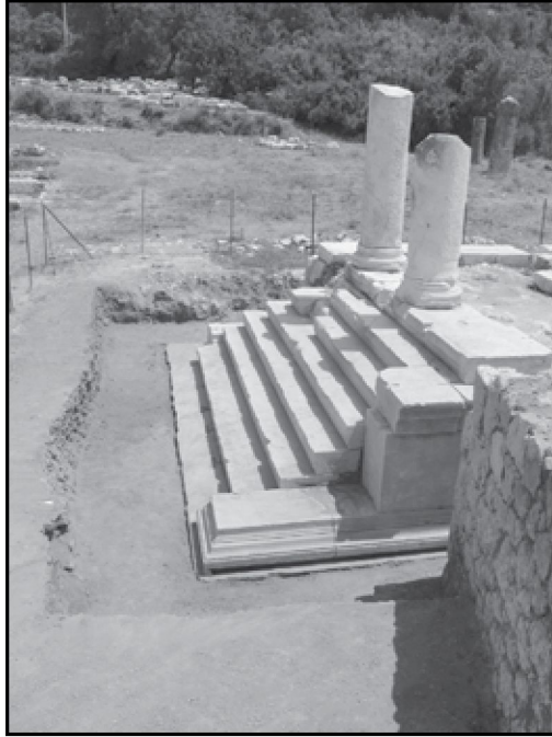
Resim 10: Kronos Tapınağı