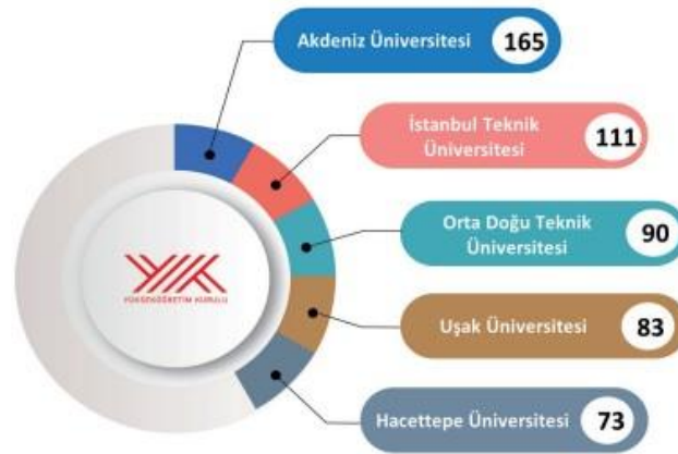
Şekil C.3.2-4 Uluslararası değişim programlarına katılan öğretim elemanı sayısının en yüksek olduğu üniversiteler