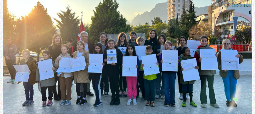
Genç ressam adaylarına ASPAG tarafından verilen Teşekkür Belgeleri töreninden bir görsel