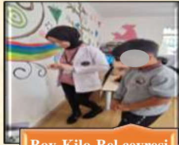
Boy-Kilo-Bel çevresi ölçümü

Okulda görev yapan 34 öğretmen arasında gönüllü olanlara kan şekeri takibi yapılmıştır. Ayrıca tüm öğretmenlerin kan basınçları ölçülmüştür. Kan basıncı ve kan şekeri ölçümlerinde anormal bulguları olan öğretmenler ASM'ye yönlendirilmiştir. Öğretmenlere ilk yardım eğitimi verilmiştir.