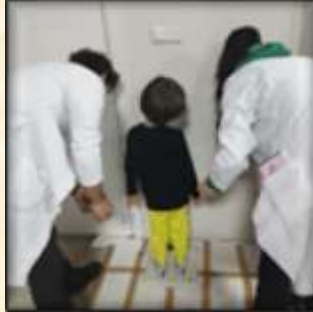
Boy-Kilo-Bel Çevresi Ölçümü