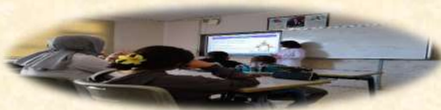
Kişisel Hijyen Eğitimi

Okulun tüm şubelerine, ders saatlerinin birinde; kişisel hijyen, çevre hijyeni ve beslenme konularında eğitimler verilmiştir. Eğitimler için öğrenciler ikişer kişilik gruplara ayrılmıştır.