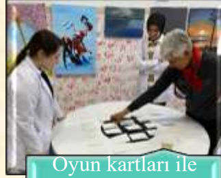
Oyun kartları ile resim eşleştirme oynama