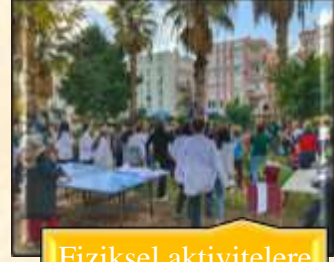
Fiziksel aktivitelere katılma