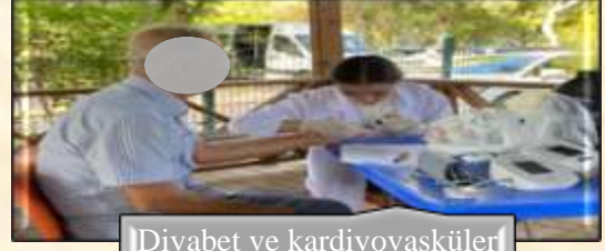
Diyabet ve kardiyovasküler hastalık riski taraması

Aktif Yaşlı Merkezi'nde Yapılan Diğer Uygulamalar: Öğrencilerimiz 60 yaş ve üzeri merkez üyeleri ile masa tenisi oynama, yürüyüş yapma ve yoga, ısınma hareketleri, çeşitli fiziksel aktivitelerin olduğu egzersiz süreçlerine katılım sağlamış ve bireylerde olabilecek riskli durumları (hipertansiyon, hipotansiyon, düşme riski vb.) önlemeye yönelik aktif katılımlı gözlemler yapmıştır. Aktif Yaşlı Merkezi'nde bulunan sağlık profesyonelleri daha sonraki yıllarda da öğrencilerimizin bu merkeze gelerek sağlık uygulamalarını yapması konusunda istekli olduklarını belirtmiştir.