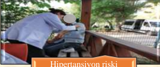
Hipertansiyon riski taraması