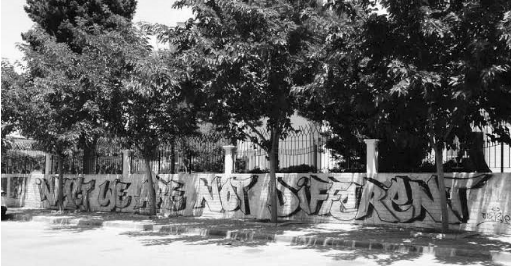
Şekil 3: Bir Okul Graffiti Uluslararası Çalışması

Farklı olmak, bir yanıyla “ötekileşme”yi getiren, ayrıştıran bir kavram durumunda iken, bir yanıyla ise “sıradışı” olma yoluyla gruptan ayrılmayı içermekte, bu iki çelişkili yönüyle insanoğlunun ilgisini çekmeyi başarmaktadır. Zira, Bilgin(2014; 202), “farklılığın dayanılmaz çekiciliği”nden söz ederken, bireylerin ait oldukları gruplarda olabildiğince farklı olmalarının diğer gruplara oranla ayırt edilir olmalarına etkide bulunduğu işaret etmekle birlikte, insan zihninin doğası gereği, çevresindeki tüm uyarıcı ve olguları karşıtlarla birlikte değerlendirdiğini vurgulamaktadır (Bilgin, 2014; 203). Karşıtlara yönelik bu bilişsel yaklaşım, tarihsel süreç içinde en küçük gruplardan başlayarak, bir arada yaşayan tüm topluluklar için belirleyici özellik göstermekte, bu sebeple kişiler ve gruplar arasındaki iletişim ve –doğal olarak- iletişimsizlikte önem taşımaktadır. Farklı olana yönelik bu algı ve yaklaşımlar, bireysel çeşitliliğin zenginliğini vurgulamaktan çok, “aynı olma” ve “tek tip” olma vurgusunun güçlenmesine ve desteklenmesine neden olmaktadır.