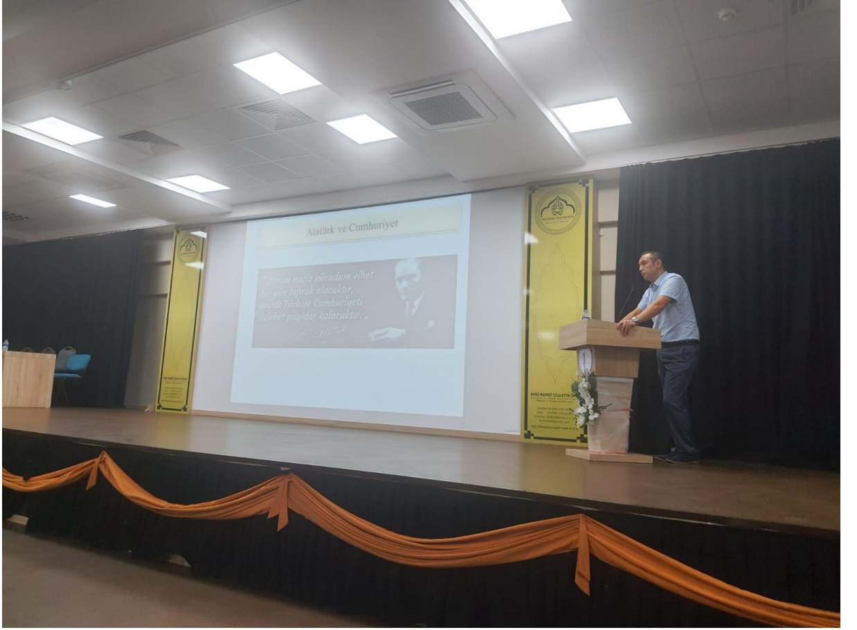
Atatürk ve Cumhuriyet Konferansı