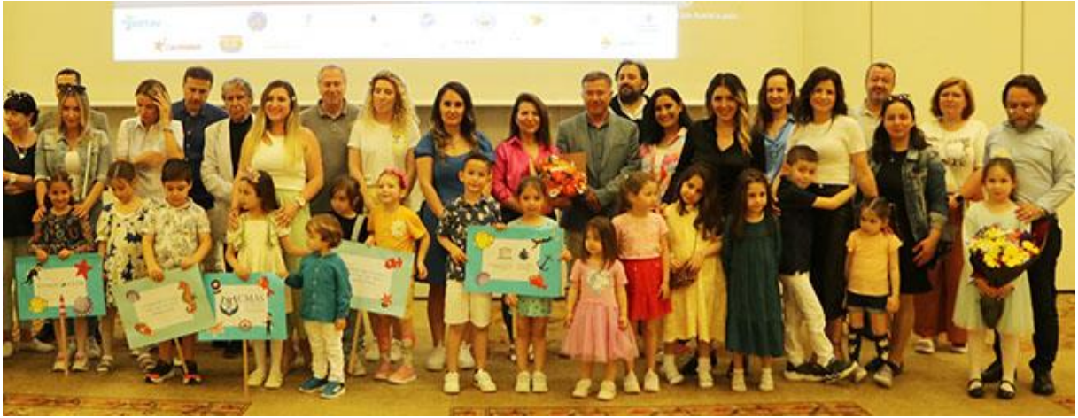
“Sualtı Dünyam” Çocuk Resim Sergisi