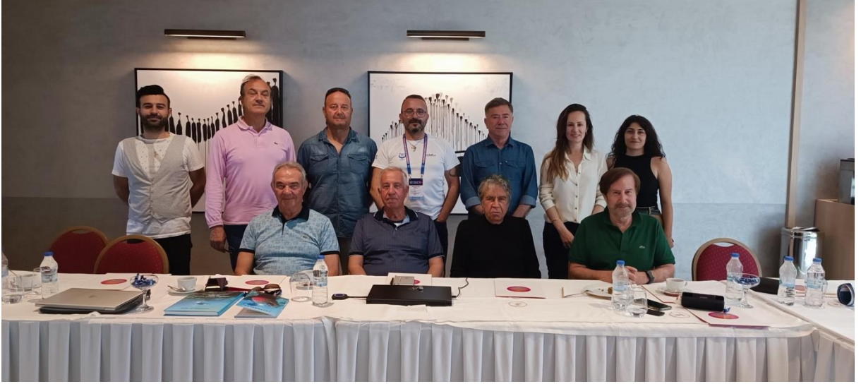
CMAS Sualtı Kltr Mirası Toplantıları