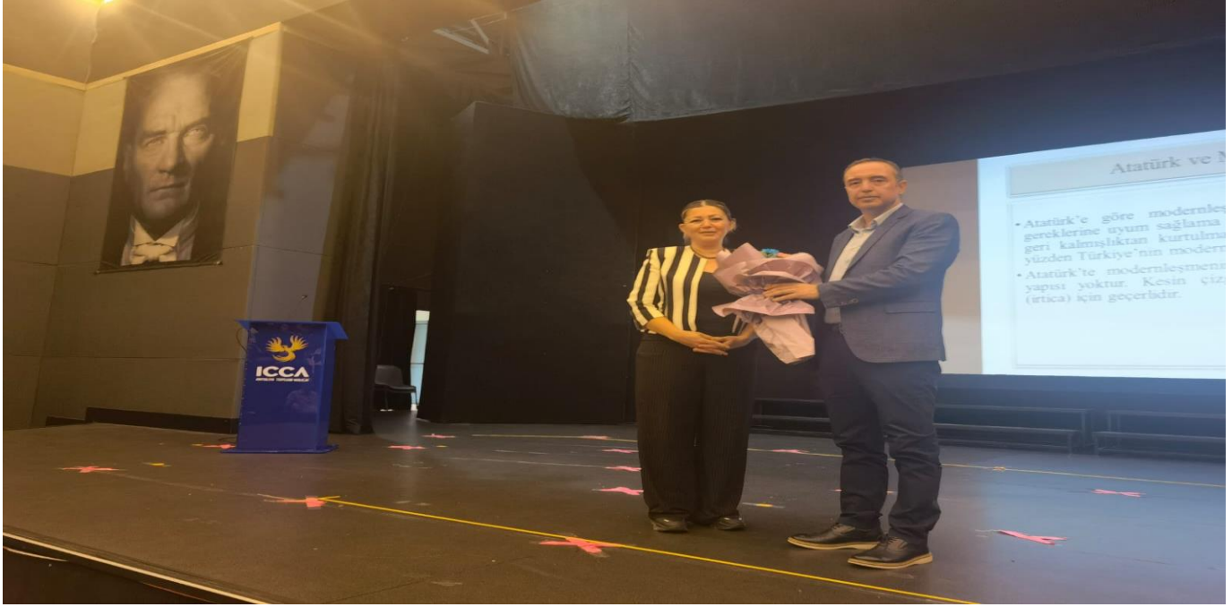
Atatürk, Modernleşme ve Cumhuriyet Konferansı