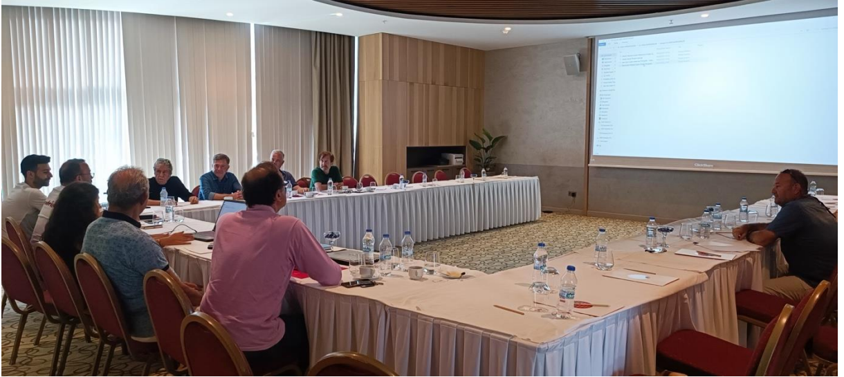
CMAS Sualtı Kltr Mirası Toplantıları