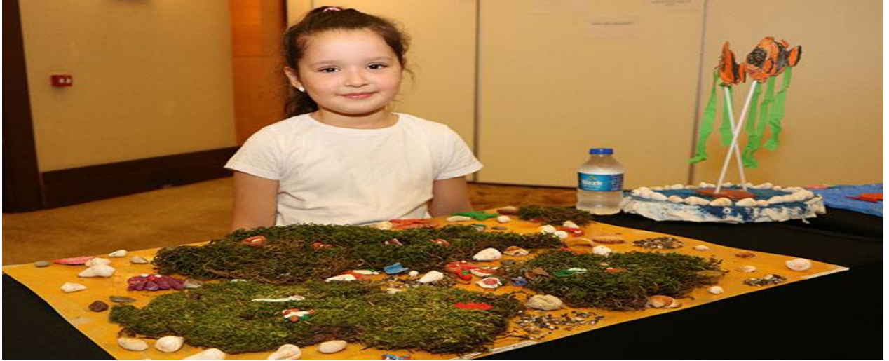
“Sualtı Dünyam” Çocuk Resim Sergisi