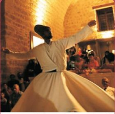
KONYA BÜYÜKŞEHİR BELEDİYESİ SEMÂ TOPLULUĞU