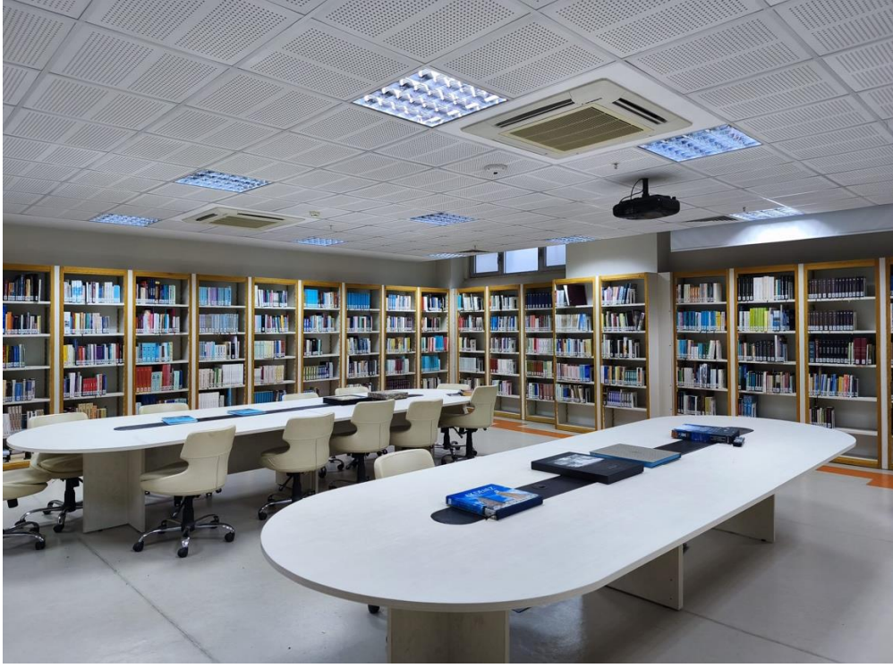
AKDENİZ UYGARLIKLARI ARAŞTIRMA ENSTİTÜSÜ SERGİ SALONU