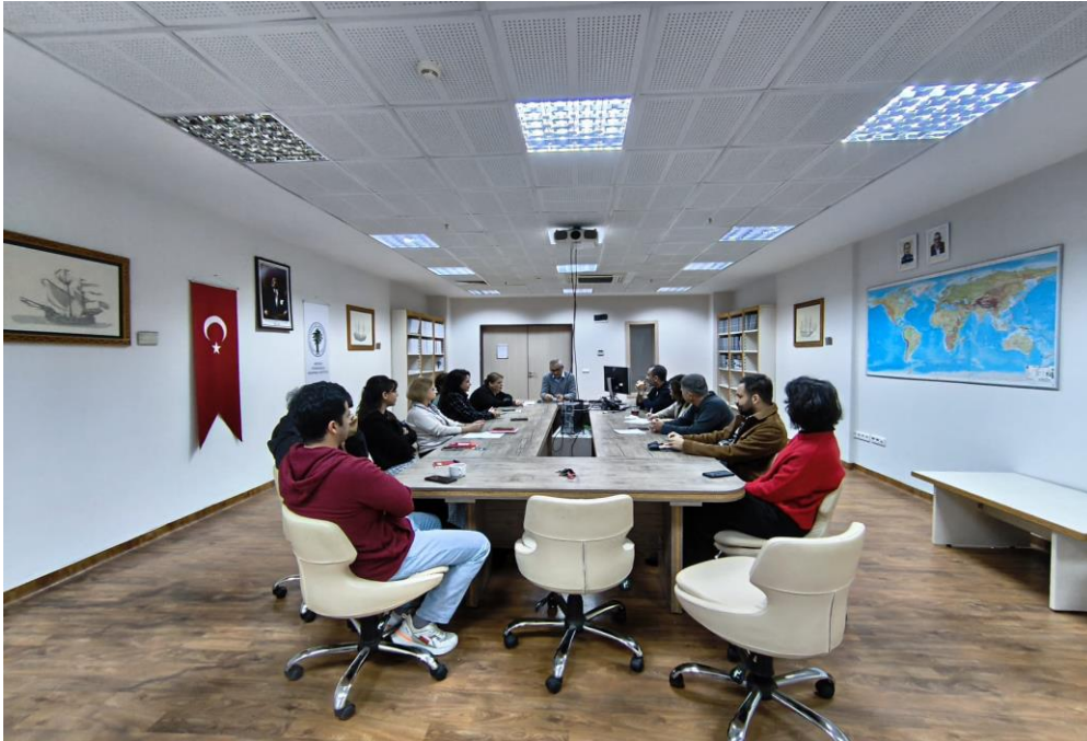
Akdeniz Uygarlıkları Araştırma Enstitüsü Halil İnalçık Kütüphanesi

Akdeniz Uygarlıkları Araştırma Enstitüsü Toplantı Salonu