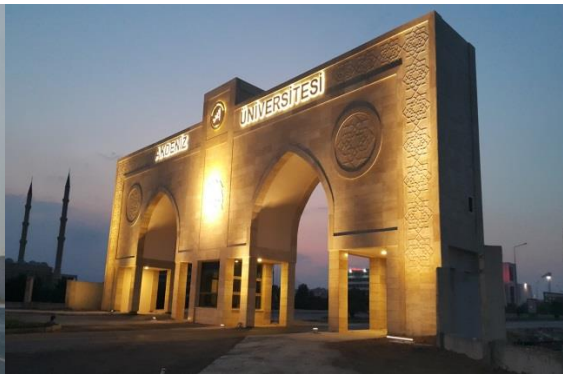
Kampüs Güney Kapısı