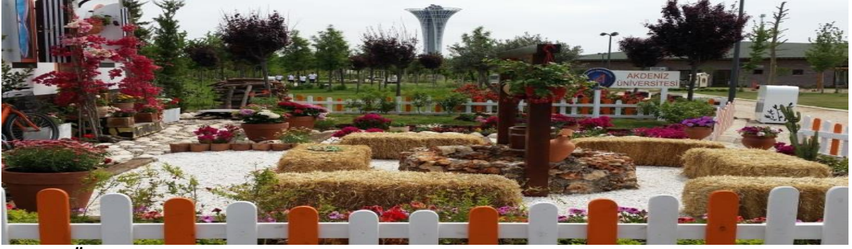
Akdeniz Üniversitesi Expo Bahçesi