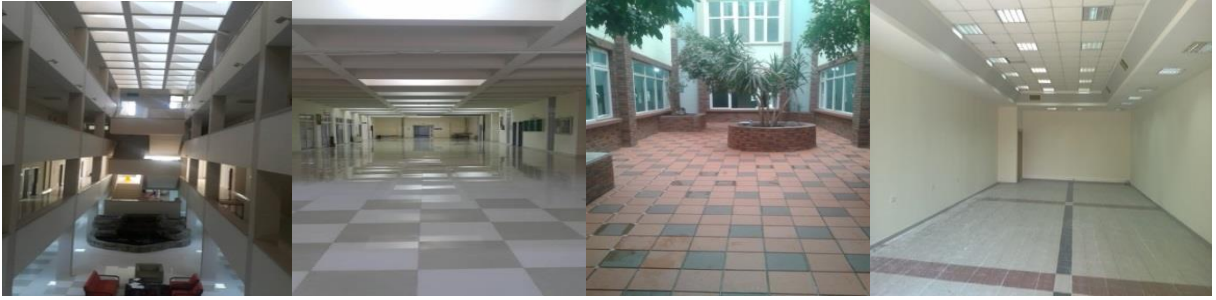
Morfoloji Genel Dolaşım Alanları

2016 yılında Morfoloji Binası genel dolaşım alanları yenileme çalışmaları, Eğitim Fakültesi Derslik ve giriş düzenleme çalışmaları, Turizm Fakültesi iç mekan tadilat düzenleme çalışmaları tamamlanmıştır. Muhtelif binalarımızın boya ve tadilat işleri yapılmıştır. 2017 yılında da benzer işler yapılacaktır.