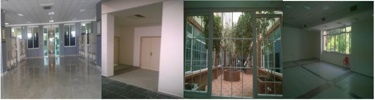
Eğitim Fakültesi Giriş ve Derslik Tadilatı