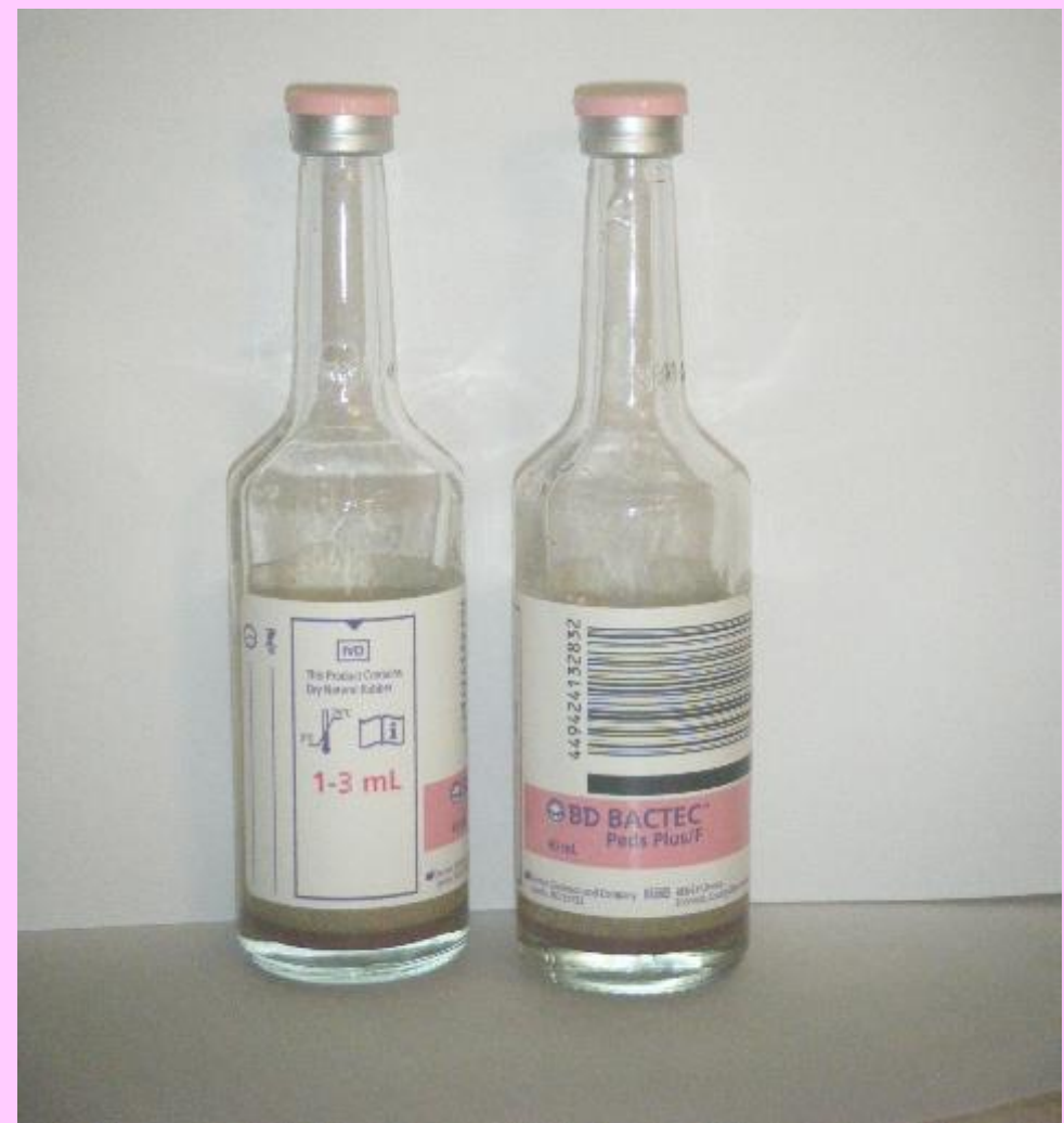
Pediyatrik kan kültür şişesi