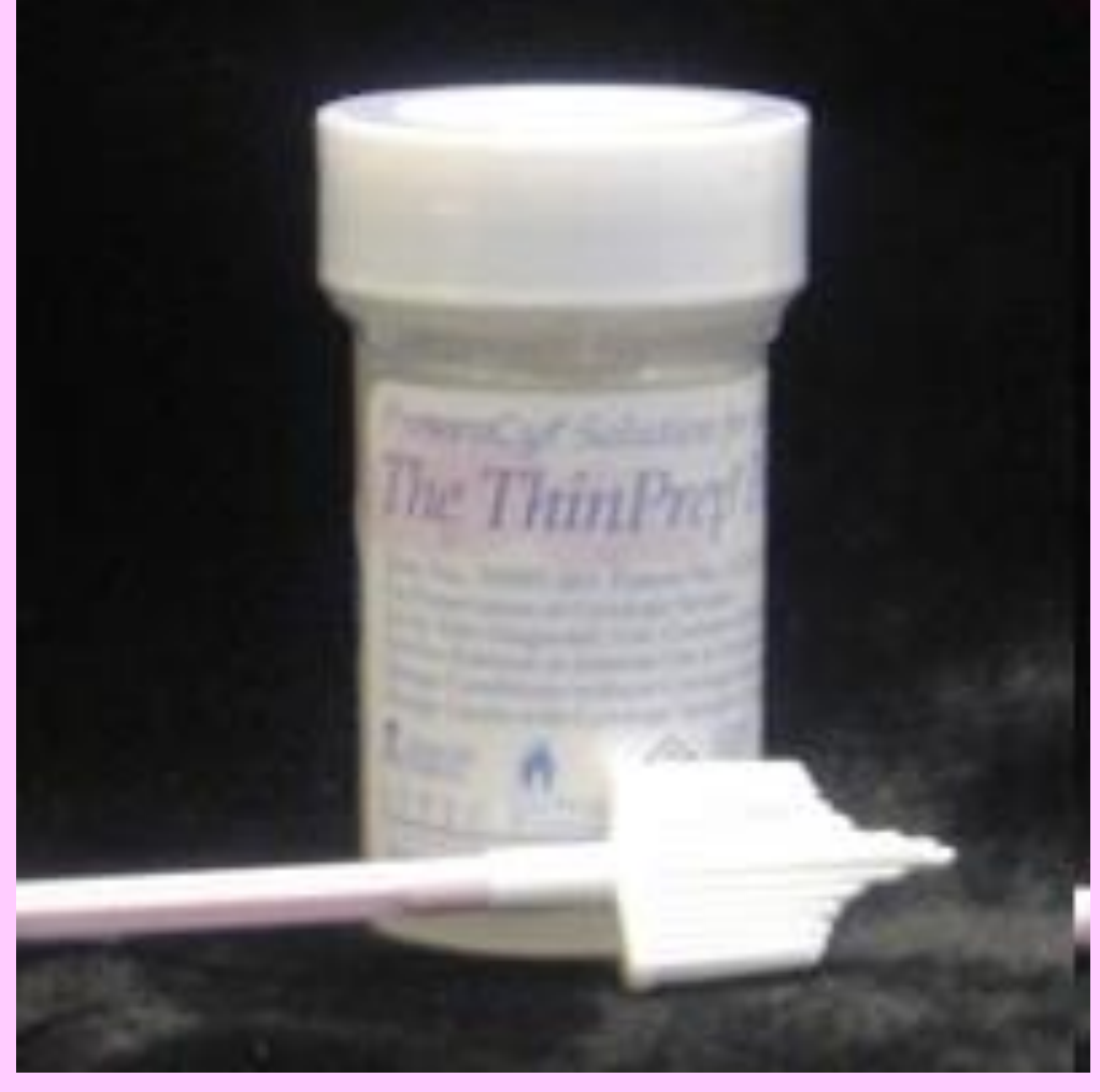
Transport kabı ve örnek alma fırçası