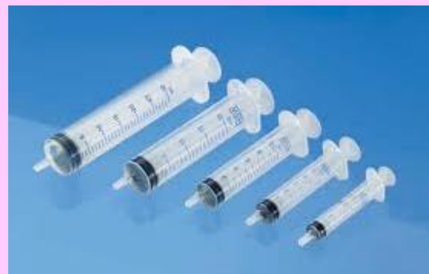
Luer look kapaklı enjektör