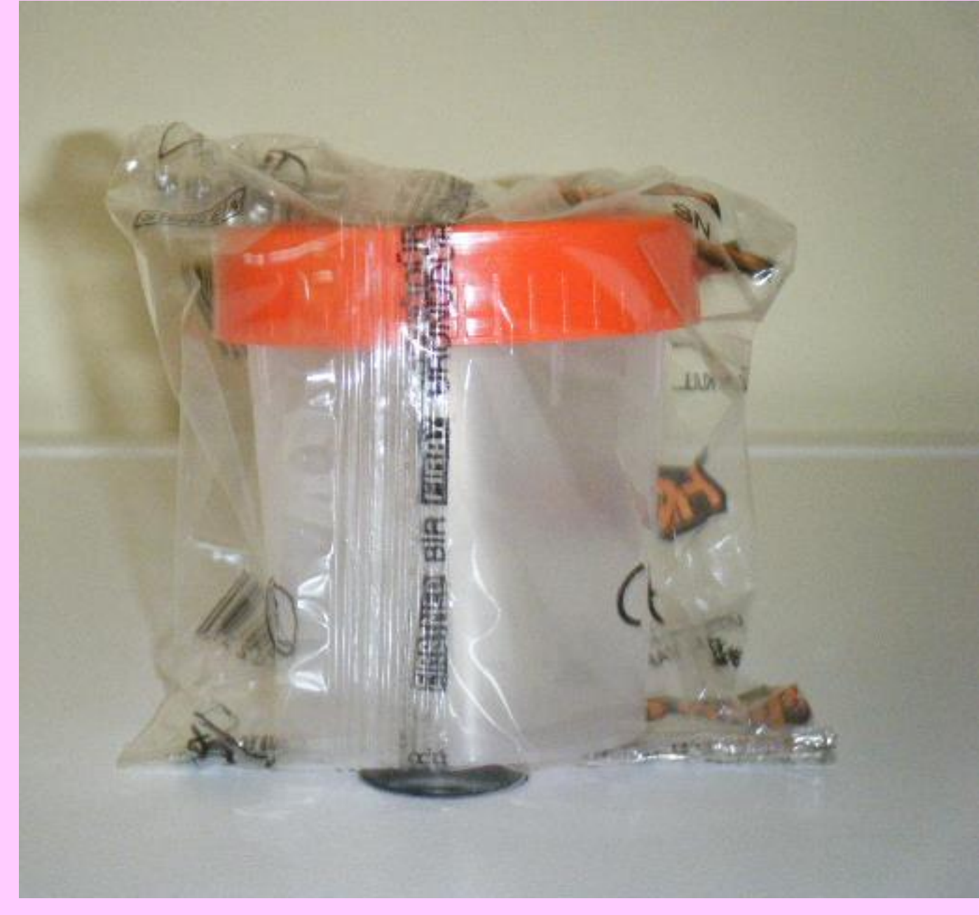
Steril örnek kabı