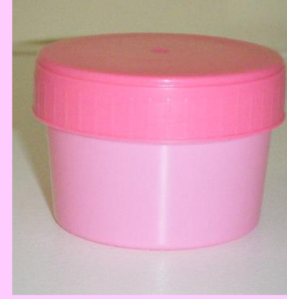
Temiz, kapaklı dışkı kabı