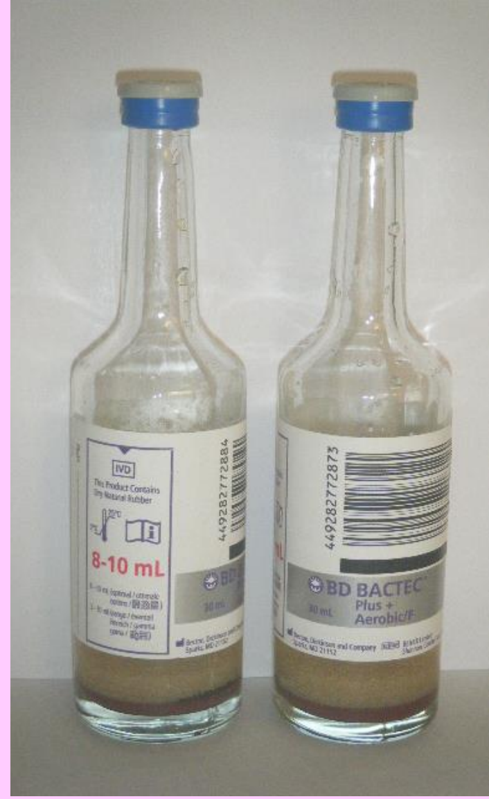
Erişkin kan kültür şişesi