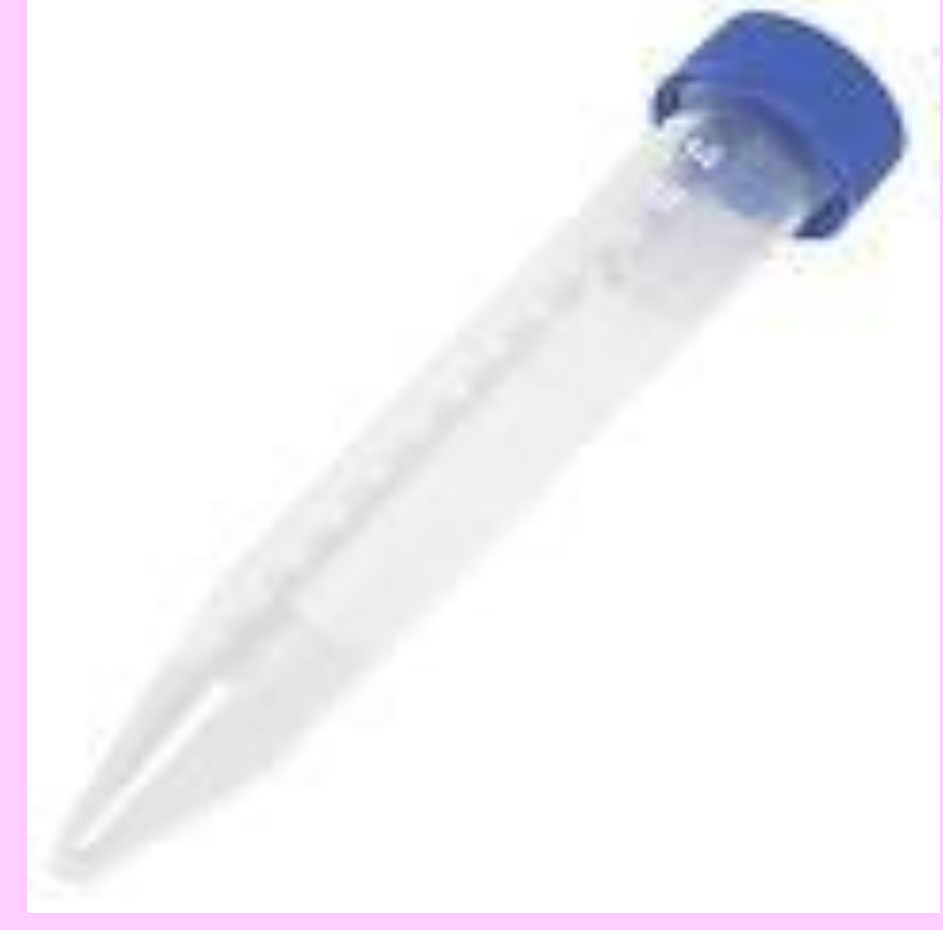
15 ml steril vida kapaklı tüp