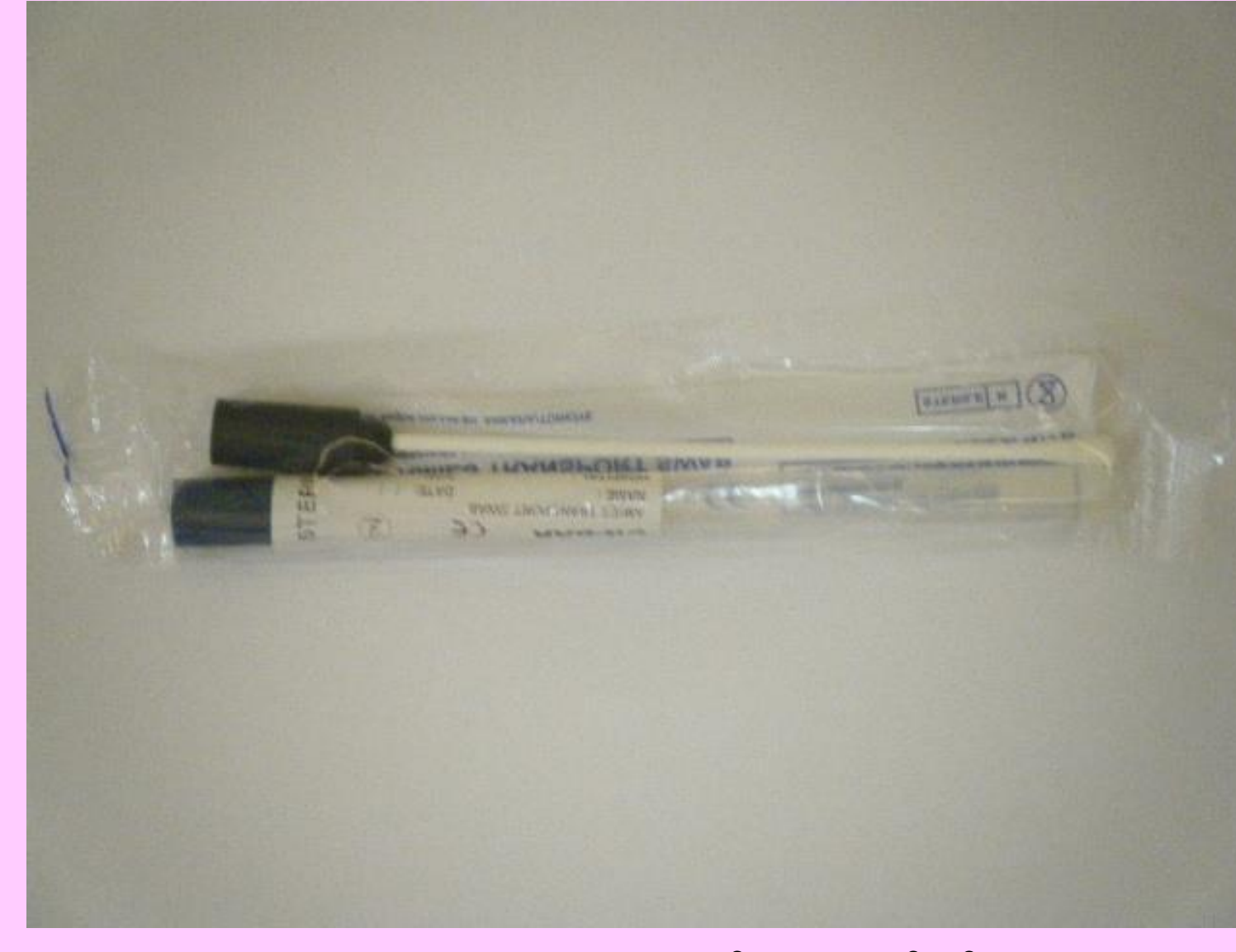
Transport besiyeri içeren steril pamuklu çubuk