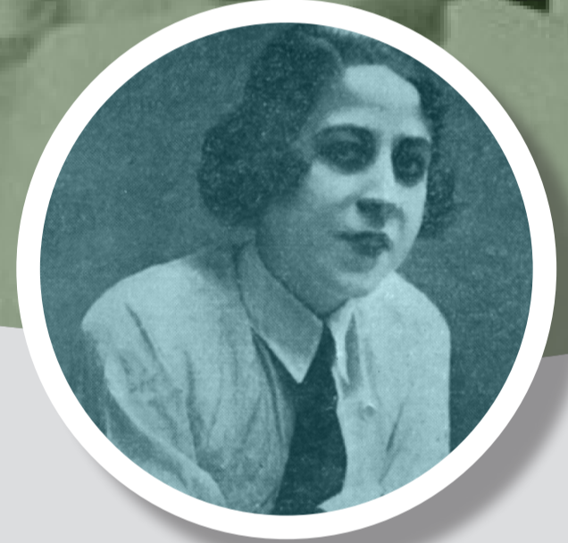
Esmâ Deniz Türkiye'nin ilk kadın hemşiresi