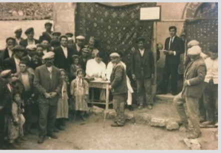
Anadolu'nun kırsal bir köyünde, sağlık taraması veya aşı kampanyası