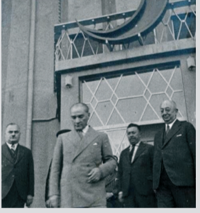
Atatürk ve Sağlık Bakanı Dr. Refik SAYDAM