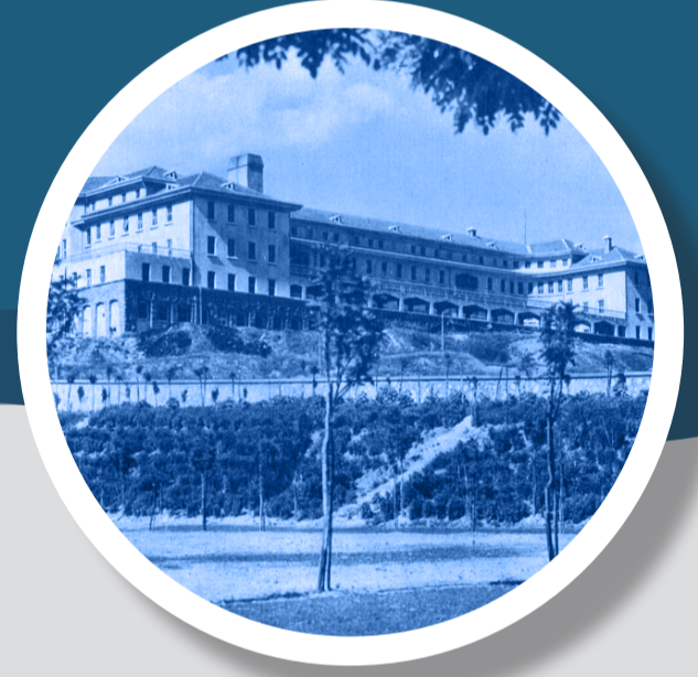
Ankara Numune Hastanesi Binası 1933