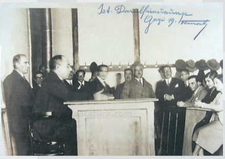
Atatürk'ün Darülfünun'u ziyareti (15 Aralık 1930)

"Hayatta en hakiki mürşit ilimdir, fendir." sözüyle Atatürk, sağlık ve tıp eğitimini salt uygulamaya değil, bilimsel araştırmaya dayanan bir sisteme dönüştürmeyi hedeflemiştir.