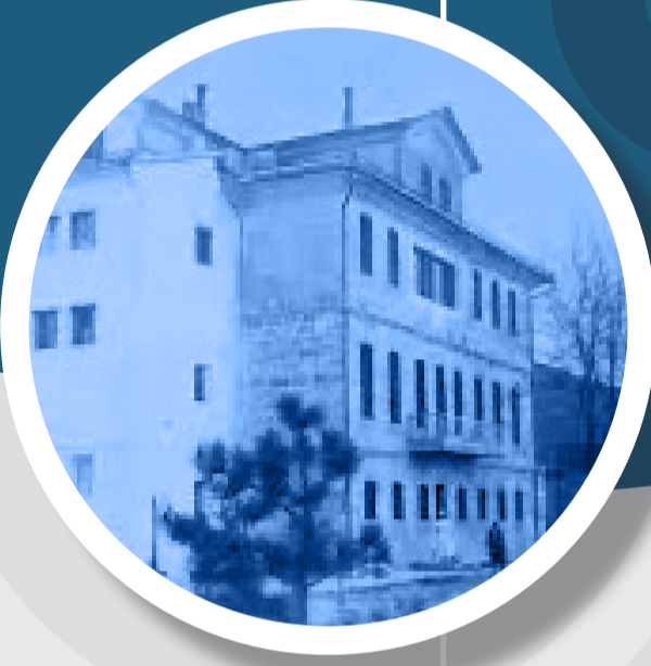
Sivas Numune Hastanesi Binası 1935