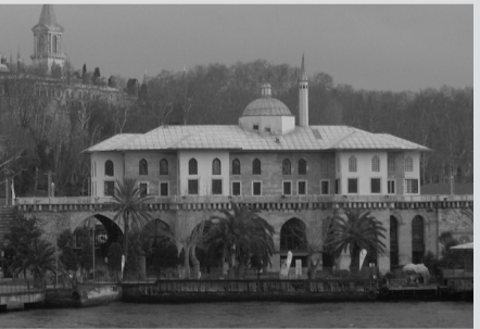
Sepetçiler Kasrı günümüzde Yeşilay Genel Merkezi olarak kullanılmaktadır.

Yeşilay, işgal güçlerinin Birinci Dünya Savaşı sırasında ve sonrasında toplumumuzda alkol ve uyuşturucu maddeleri yaygınlaştırmasına karşı, milletin direncini ve mücadele ruhunu korumak amacıyla kurulmuştur.