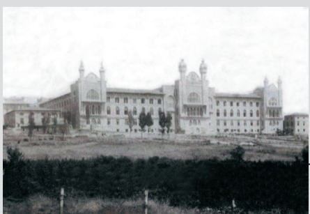
Haydarpaşa'daki Mekteb-i Tıbbiye-i Şahane (Askeri Tıbbiye)

Cumhuriyet, yalnızca bir yönetim değişikliği değil; bilim, sağlık ve insan yaşamına verilen değerlerin devrimidir. Sağlık, Cumhuriyet'in en büyük kazanımlarından biridir.