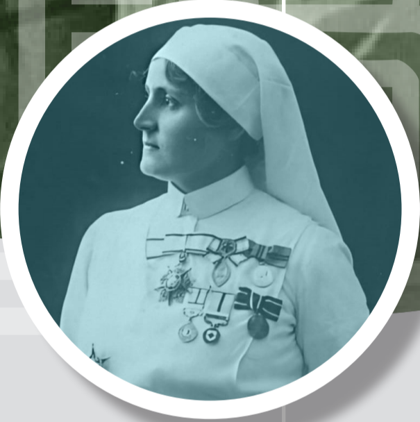
Hemşirelik Tarihinde Bir Öncü Safiye Hüseyin Elbi