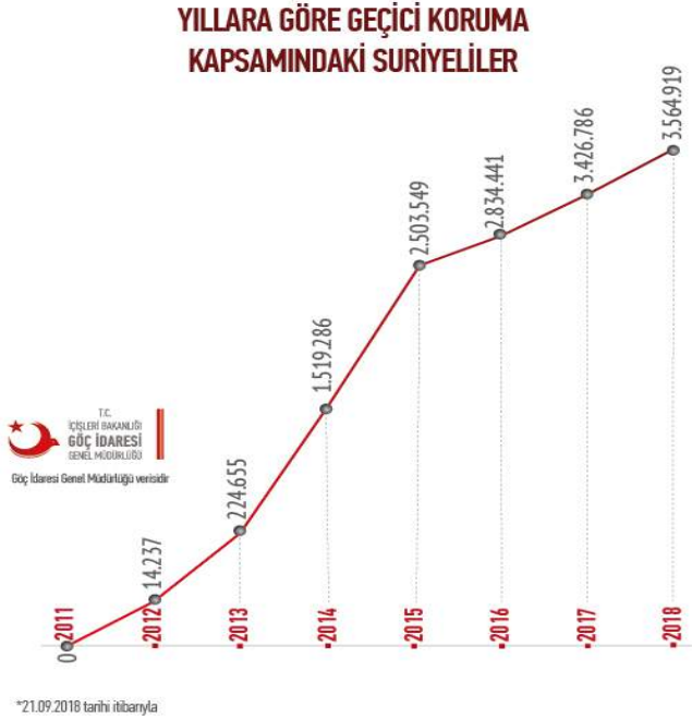
Şekil 1. Geçici Koruma Altına Alınan Suriyeli Yabancıların Rakamları (2018)